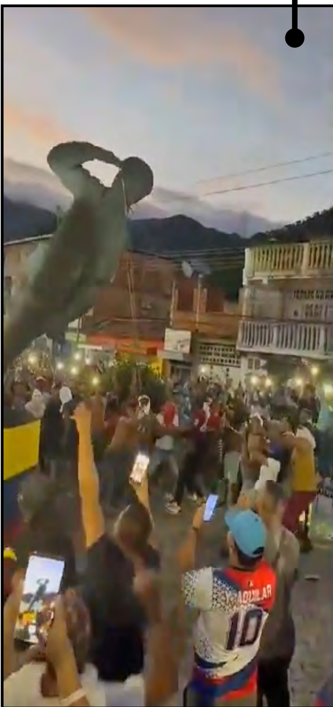
La Guaira 29.07.24 7:50 pm