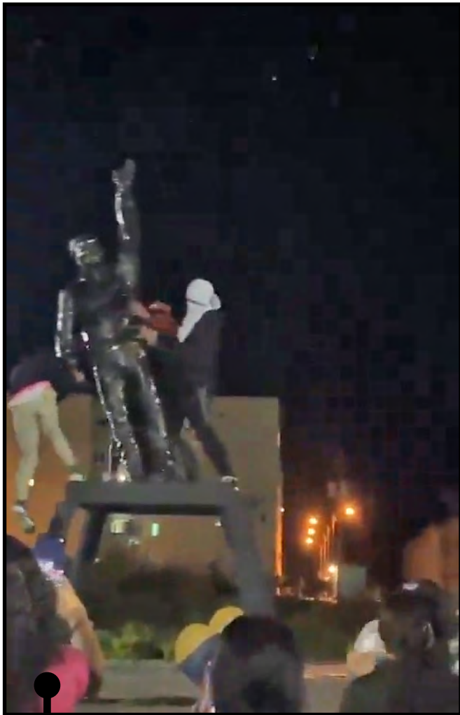
Los Teques 29.07.24 9:00 pm