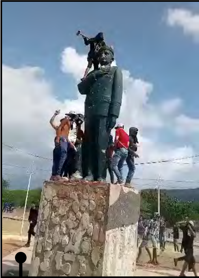
Coro 29.07.24 3:00 pm