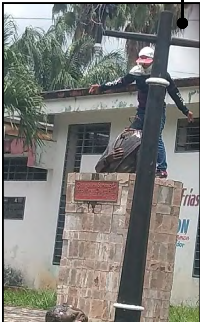
Bolívar 30.07.24 10:20 am