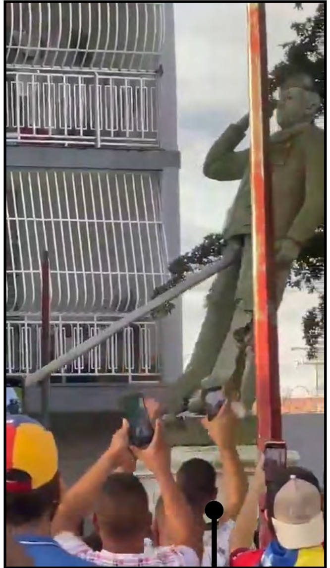
Calabozo 29.07.24 6:30 pm