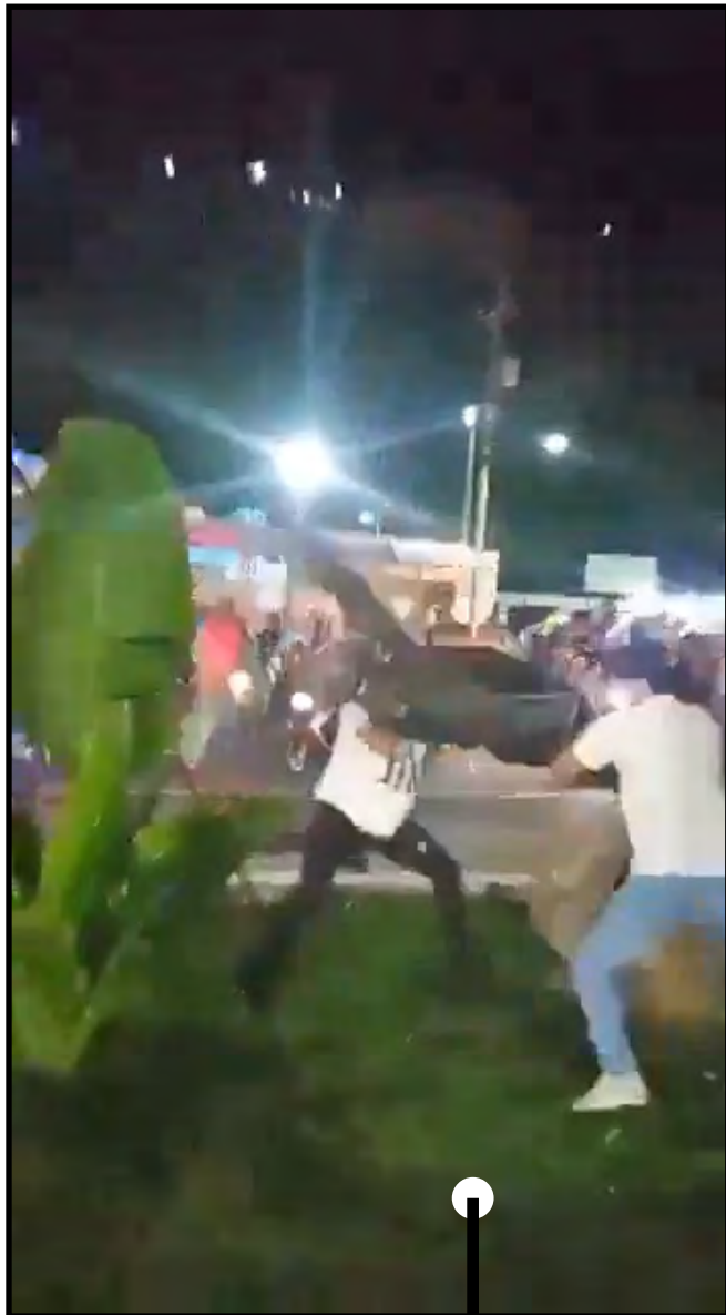
Tejerías 29.07.24 9:26 pm