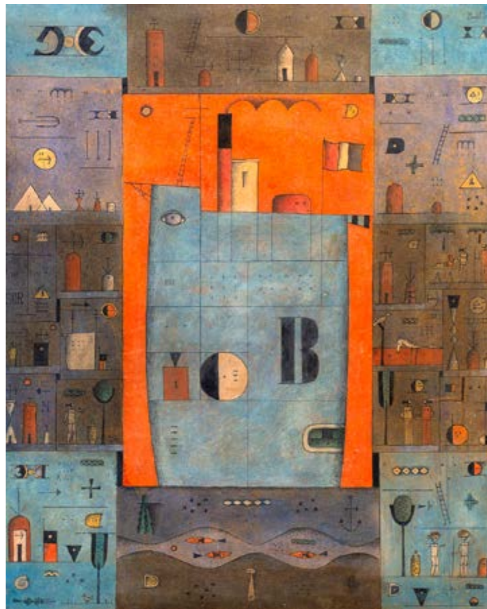
▲ “Constructivismo con barco” (Manuel Pailós- S/F)

del Constructivismo Universal participando de todas las exposiciones colectivas del taller y en la realización de los murales en el Pabellón Martirén del Hospital Saint Bois en 1944. Comenzó a exponer a partir de la segunda mitad de la década del cincuenta en forma colectiva e individual hasta conseguir inaugurar una muestra personal anual. Participó de numerosas muestras en Uruguay, Argentina, Colombia, Paraguay, EUA y España. En 1991 es invitado por la Xunta de Galicia para realizar una exposición en Santiago de Compostela y una obra escultórica para los jardines de la Facultad de Economía. Ha sido galardonado, entre otros, con el Premio adquisición del Salón Municipal de Montevideo (1960, 1961 y 1967), Gran Premio Salón Nacional de Montevideo (1968, 1969 y 1970), Premio Figari que otorga el Banco Central del Uruguay en mérito a su trayectoria artística (1996), medalla de oro en el Salón de Primavera de Salto (1970). Su obra forma parte del acervo de museos uruguayos, argentinos y españoles, así como de destacadas colecciones privadas a nivel internacional. Quienes lo conocieron destacan su modestia y perfil bajo, cordialidad y discreción. Pablo Thiago Rocca destaca su “laboriosidad férrea y la capacidad de extender los dominios del arte hacia los más variados sitios y con los más increíbles recursos.” Pintor, ceramista y escultor experimentó con materiales diversos en el campo de la escultura (ladrillo, cemento, madera) y con la técnica de la encáustica (antigua